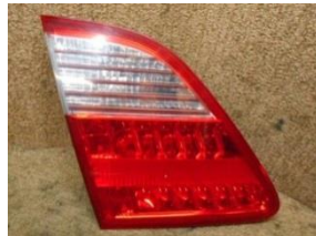
H16年 GRS180 クラウンフィッシャーライト