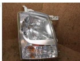
H17年 MH21S コンパ右ヘッドライト