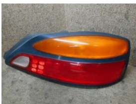
H11年 S15 シルビア右テールライト