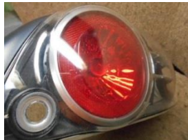
H15年 SE3P RX-8 右テールライト